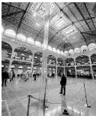
Un'installazione in Sala Borsa

Tutti i musei civici, Archiginnasio e Sala Borsa, gallerie e negozi restano aperti fino alle 24