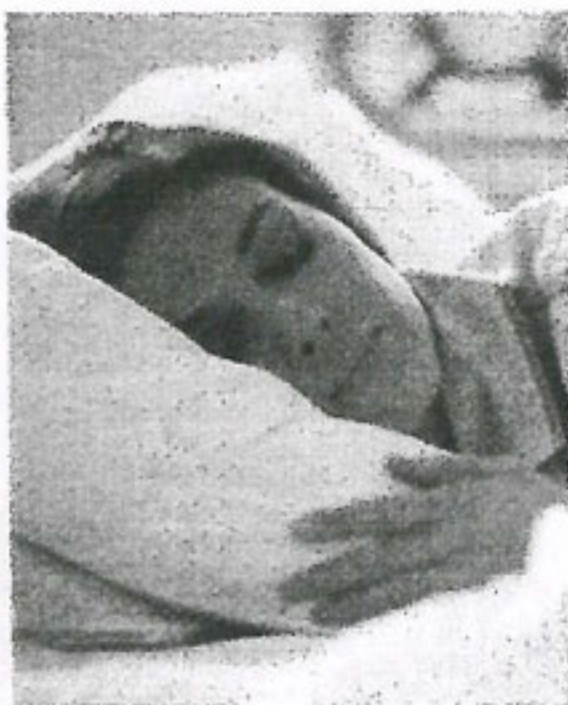
La teoria del sonno

La teoria e i consigli pratici per un buon sonno. All'hammam Sahara di via Benaco 1 si impara l'arte di sognare grazie a tre incontri teorici-esperienziali programmati per il 14, il 21 e il 28 aprile. Oltre alla teoria del sonno e del sogno, si insegnano semplici esercizi yoga di